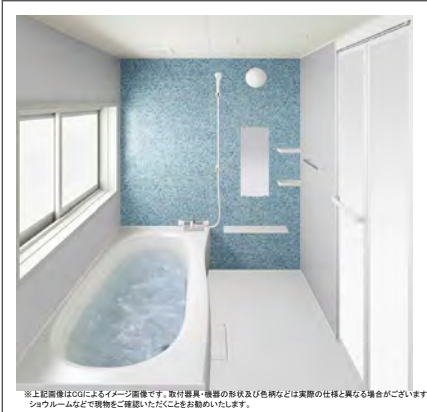
※上記画像は3Dによるイメージ画像です。取付器具・機器の形状及び色柄などは実際の仕様と異なる場合がございます。ショールームなどで実物を確認いただくことをお勧めいたします。

画像はモニターでグラフィックで作成したイメージです。ご提案プランの詳細仕様はお見積書をご確認ください。製品の色は印刷のため、実物とは多少色が異なります。