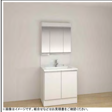
※画像はイメージです。組合せなどはお見積書をご確認ください。

製品の色は印刷のため、実物とは多少色が異なります。実際の色合い・材質感は、ショールーム等でご確認ください。