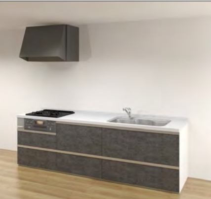
カウンター高さ 850mm ※画像はイメージです。組合せなどはお見積書をご確認ください。